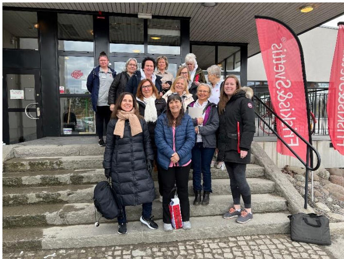
Ett gäng receptionsvårdar på utbildning med Riks på F&S Södertälje. April 2022.

2022 var strax under 100 ideella funktionärer aktiva i vår förening. Funktionärer är medlemmar som väljer att på sin fritid engagera sig extra i vår förening. I sina olika funktioner är dessa personer viktiga kuggar i hjulet som driver vår föreningsverksamhet varje dag. Våra funktionärer gör en helt ideell insats för alla medlemmar som tränar i föreningen. Ett stort tack till alla fantastiska funktionärer i Friskis Haninge!