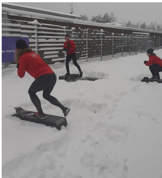
Utefys. November 2022.