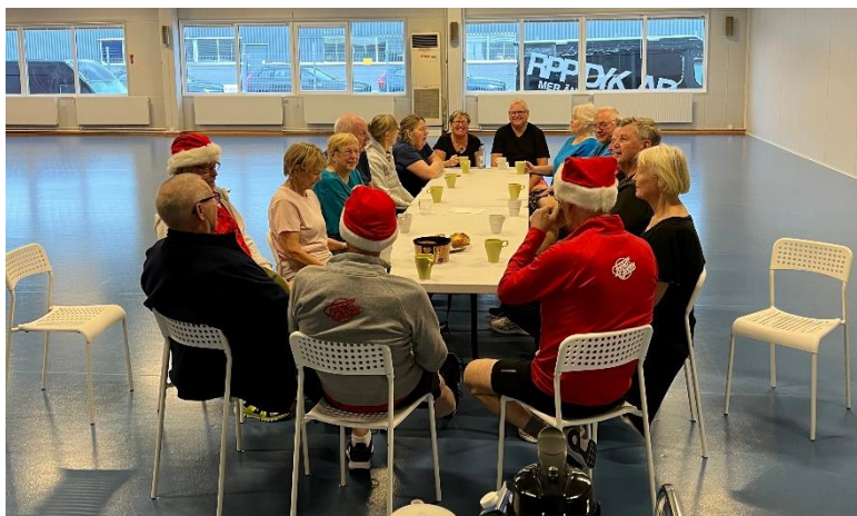
Avslutningsfika för Seniorklubbens tisdagsgång. December 2022.

Under hösten har vi haft en inspirationsdag för både befintliga och (förhoppningsvis) blivande medlemmar. Dagen erbjöd korta, 30 minuters prova-på-pass från hela vårt träningsutbud. Det hölls två föreläsningar, den ena med en inhyrd extern föreläsare på temat motivation och den andra med en lokal föreläsare på temat rörlighet.