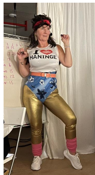
Spex på kick-offen 2022.