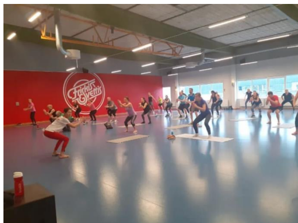
Coreflex. November 2022.