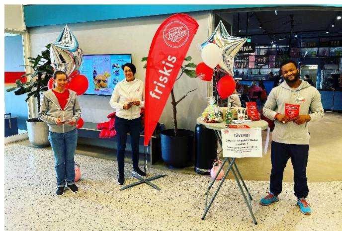
Kampanjarbete på ICA Maxi Haninge. April 2022.