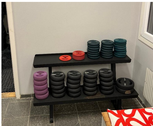
Ny förvaring för vikter till uteträningen.

Vi har fortsatt samarbetet med vår nya fastighetsägare där fokus har legat på optimering och upprustning av våra lokaler. Stora problem med ventilationen har upptäckts under året och en omfattande renovering planeras. Tills vidare sätts tre stycken AC-aggregat upp på anläggningen för att hjälpa befintlig ventilation på traven.