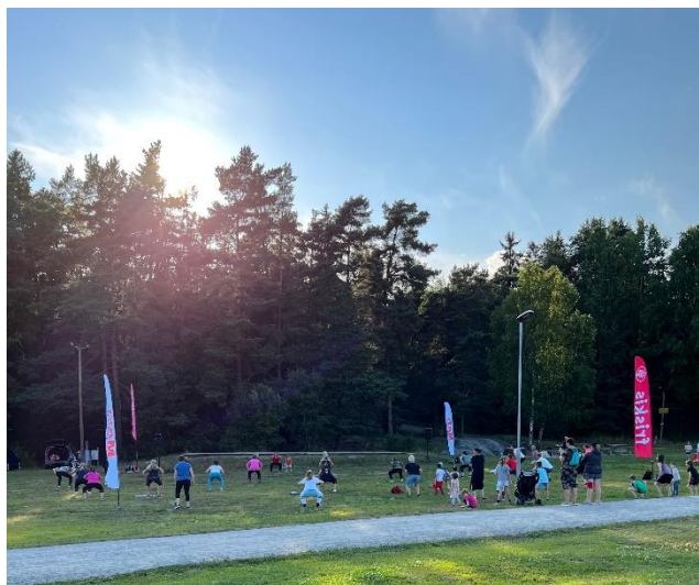
Parkträning i Rudan. för stora och små. Juli 2022.

Vi har fortsatt vårt samarbete med Fredrika Bremers Idrottsakademier samt haft samtal med andra idrottsföreningar om framtida samarbeten för att hjälpa unga att komma i rörelse samt sänka tröskeln för människor som kan ha svårt att hitta in i en träningsrutin.